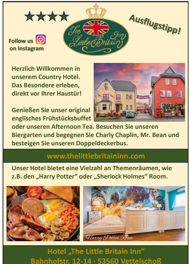
Foto des Monats