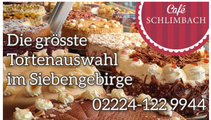
Foto des Monats

Weilbergstraße 29 · 53604 Bad Honnef-Aegidienberg Tel. 0 22 24/82 03 37 · info@baumservice-stockhausen.de www.baumservice-stockhausen.de