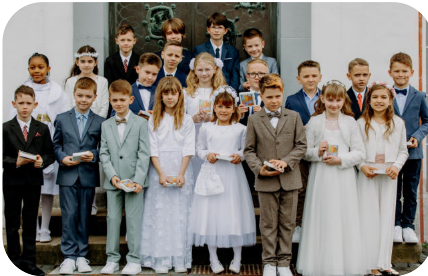
Die Erstkommunionkinder 2024

Zum feierlichen Abschluss zogen Pfarrer Ottersbach und seine Messdiener mit den Erstkommunionkindern unter dem Gesang des Chores und der zahlreich versammelten Familien aus der Kirche aus.