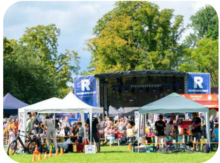
Familiennachmittag bei R(h)einspaziert 2023.

Weitere Informationen unter www.sjr-honnef.de und https://freeyo.de