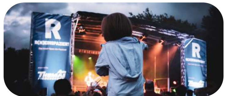
R(h)einspaziert lockt seit mehr als 30 Jahren die Fans auf die Insel Grafenwerth.

Mehr zu R(h)einspaziert auch im Internet: www.rheinspaziert.de