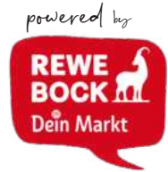
Foto des Monats