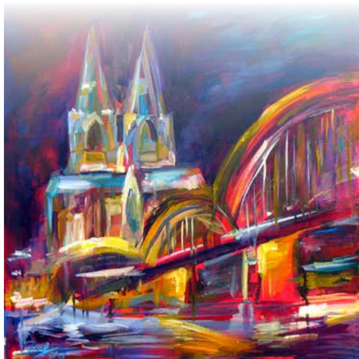
Kölner Dom Nacht 1

Am Sonntag, dem 23.11., ist die Ausstellung von 14:00 bis 18:00 Uhr geöffnet.