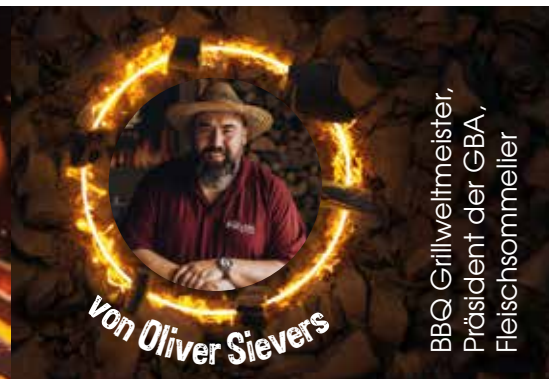
BBQ Grillweltmeister, Präsident der GBA, Fleischsommelier