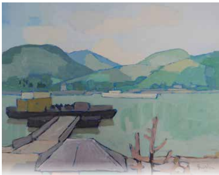
Landschaftsdarstellung von Hugo Gülden