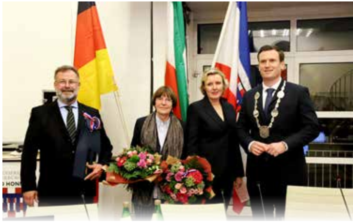
Konstituierende Ratssitzung Bad Honnef, 6.11.2025