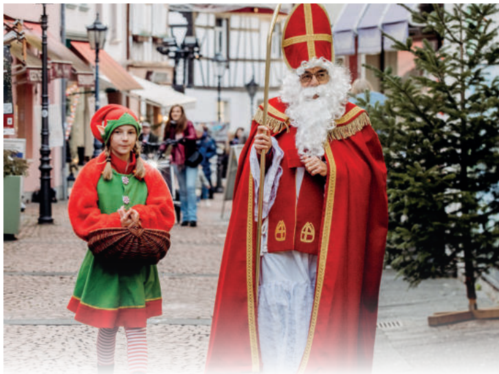
Der Nikolaus machte sich jeden Tag um 16 Uhr mit der Elfe auf den Weg durch die Kirchstraße zum Festzelt.