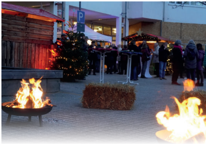
(Foto) Bereits zum fünften Mal bedankte sich die Stadt Bad Honnef bei den ehrenamtlichen Helferinnen und Helfern mit einem Ehrenamts-Weihnachtsmarkt.