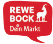
Foto des Monats