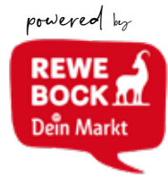
Foto des Monats